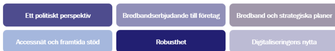
Figur 4.1: Kapitlet ger en översikt över sex viktiga aspekter för bredbandsutbyggnad.

Delrapporterna i utvärderingen har inkluderat ett flertal fördjupningsområden av relevans för bredbandsutbyggnaden: ett politiskt perspektiv, bredbandserbjudande till företag, bredband och strategiska planer, accessnät och framtida stöd, robusthet samt digitaliseringens nytta. I det här avsnittet presenteras vart och ett av områdena kort. Fördjupningsområdena återfinns i sin helhet i delrapport två, tre och fyra. 9